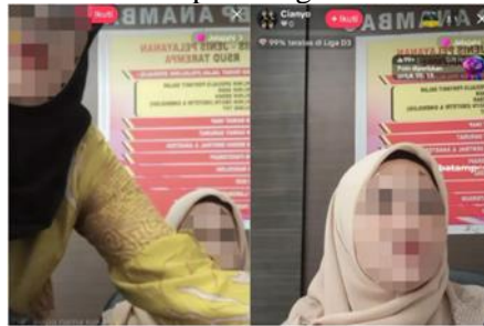
Gambar 1. ASN RSUD Tarempa Diduga Live TikTok Saat Jam Kerja

Tangkapan layar ASN Anambas ayuk live TikTok saat jam kerja.