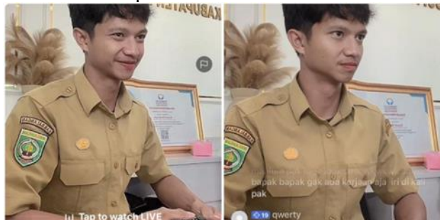
Gambar 4. Pria Berpakaian Dinas Live TikTok di Jam Kerja

Di Gorontalo, seorang guru yang mengenakan seragam dinas ASN melakukan siaran langsung di TikTok yang diduga berlangsung pada jam kerja, dan video tersebut menjadi viral di media sosial. Kejadian ini langsung mendapat teguran dari dinas setempat melalui akun resmi mereka saat siaran masih berjalan.