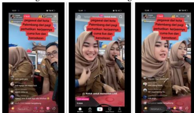
Gambar 5. Orang ASN Pemkot Palembang Live TikTok-Karaokean