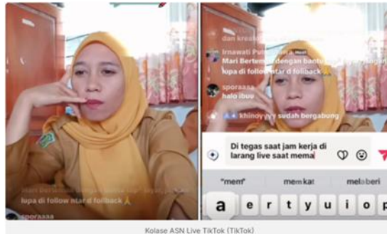
Kolase ASN Live TikTok