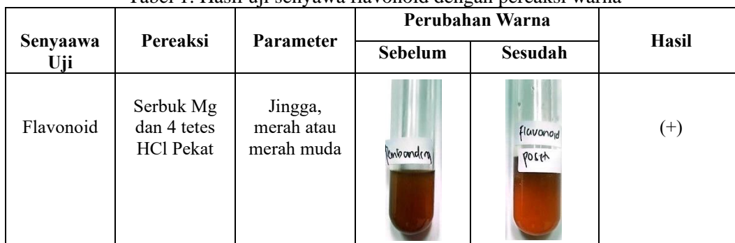
Tabel 1. Hasil uji senyawa flavonoid dengan pereaksi warna

Tabel 1 menunjukkan hasil pengujian senyawa metabolit sekunder yang positif pada sampel yang mengandung Kelor ( Moringa oleifera ) dan Meniran ( Phyllanthus niruri ). Warna kuning hingga jingga menunjukkan hasil pengujian flavonoid, sesuai dengan pernyataan Oktavia and Sutoyo (2021), bahwa perubahan warna menunjukkan keberadaan flavonoid.