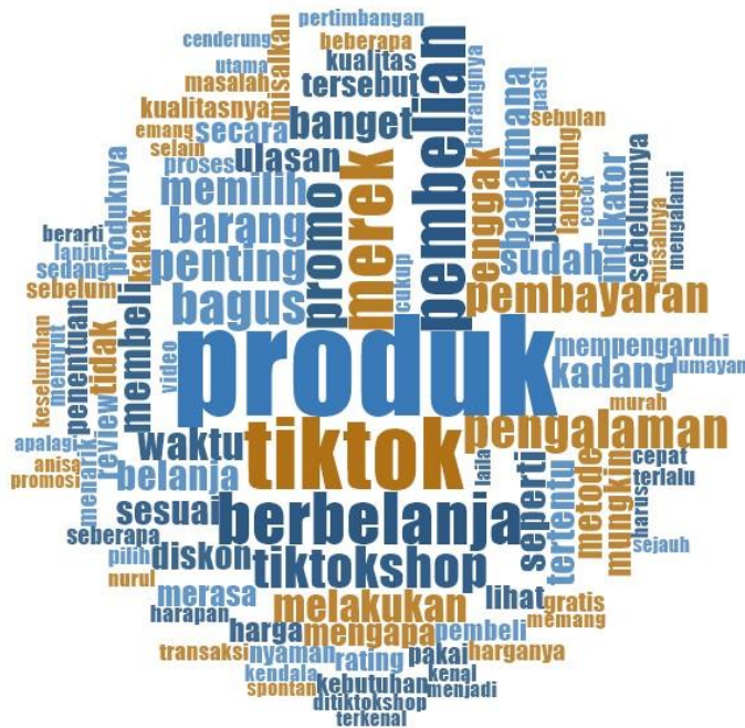
Gambar 1.8 word cloud

dapat dikatakan sebagai faktor kunci yang paling memengaruhi keputusan pembelian di TikTok Shop.