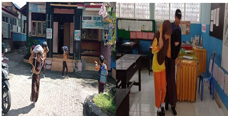
Gambar 4. Simulasi Tanggap Darurat

Kegiatan simulasi dilaksanakan di dalam kelas dan di luar kelas tampak pada gambar 4. Bahwa mereka diberikan arahan dan penyelamatan di daerah evakuasi yang sudah disediakan dengan melihat tempat tersebut sudah aman dari risiko terkena reruntuhan. Tampak pada gambar 4 Siswasiswi sangat antusias ketika simulasi. Hal tersebut dapat dilihat dari cepatnya mereka dalam lari dan pergi ke tempat evakuasi atau arahan yang sudah diberikan. Misalnya ketika mereka disuruh untuk berlindung di bawah meja. Mereka langsung berlindung di bawah meja ketika terdengar bunyi peringatan bahaya dan dapat melihat situasi sehingga mereka menuju tempat yang sudah di arahkan. Sikap antusias menunjukkan respon yang positif. Kesiapsiagaan dan percaya diri dalam menghadapi situasi darurat. Beberapa siswa mengungkapkan bahwa dengan adanya simulasi langsung dan panduan contoh. Sehingga lebih memahami dan mengerti, misalnya berlindung di bawah meja atau mencari tempat evakuasi yang membuat siswa dan siswi bisa melindungi diri ketika terjadi situasi darurat. Tidak hanya membuat siswa dan siswi siap siaga yang kuat dan juga kegiatan tersebut menambah wawasan siswa dan siswi.