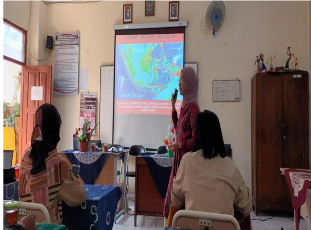
Gambar 3. Kegiatan sosialisasi