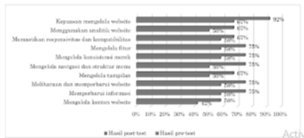
Gambar 3. Hasil pre-test dan post-test peserta

Pemberian pre-test dan post-test dilakukan untuk mengevaluasi peningkatan kemampuan peserta dalam mengelola company profile website sebelum dan setelah pelaksanaan knowledge transfer, serta pendampingan selama dua minggu setelahnya. Aspek-aspek kemampuan yang dinilai beserta hasil pre-test dan post-test peserta dapat dilihat pada Gambar 3.