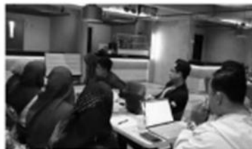
Gambar 1. Situasi kegiatan knowledge transfer bersama rekan

Kegiatan inti dalam program pengabdian kepada masyarakat ini adalah penyaluran pengetahuan mengenai penggunaan company profile website dan Google Business yang telah dikembangkan oleh tim pengabdian. Acara ini diadakan pada hari Kamis, 25 Mei 2023, di lokasi yang disediakan oleh PT. Adam Djaya Teknik, dengan judul kegiatan “Knowledge Transfer Penggunaan Company Profile Website sebagai Sarana Promosi dan Pemasaran Digital PT. Adam Djaya Teknik”. Hadir dalam acara ini adalah tiga perwakilan dari mitra, yaitu general manager, manajer pemasaran, dan salah satu staf pemasaran perusahaan. Pada kesempatan tersebut, perwakilan mitra membawa laptop masing-masing untuk digunakan dalam praktik penggunaan website dan Google Business ini dapat dilihat di gambar 1.