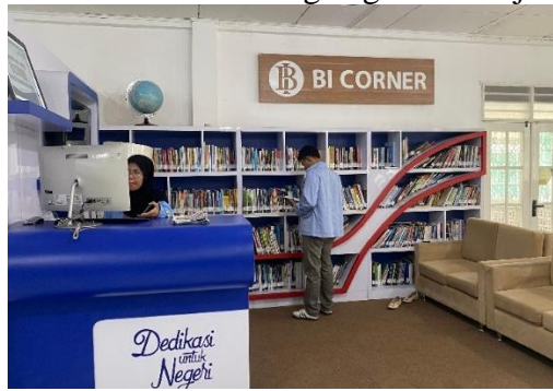
Gambar 4. BI Corner Perpustakaan UMP

komputer, dan akses internet untuk mendukung kegiatan belajar dan penelitian.