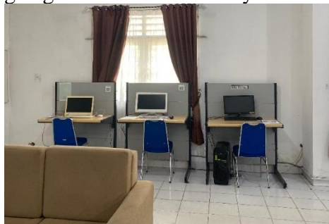
Gambar 5. Fasilitas Komputer Untuk Pengguna

Perpustakaan Universitas Muhammadiyah Palembang tidak hanya menyediakan koleksi cetak maupun digital, tetapi juga dilengkapi dengan fasilitas teknologi yang mendukung kenyamanan dan efektivitas layanan. Fasilitas komputer tersedia untuk membantu pemustaka dalam melakukan penelusuran informasi, mengakses sumber daya elektronik, serta menunjang kegiatan akademik lainnya.