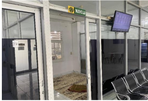
Gambar 8. Mushola Perpustakaan UM Palembang

Sebagai bentuk layanan inklusif, perpustakaan juga memperhatikan kebutuhan pemustaka berkebutuhan khusus dengan menyediakan akses difabel. Fasilitas ini memungkinkan pengguna dengan keterbatasan fisik tetap dapat mengakses layanan dan ruang perpustakaan secara mandiri. Dengan adanya fasilitas penunjang tersebut, perpustakaan Universitas Muhammadiyah Palembang tidak hanya berfungsi sebagai pusat informasi, tetapi juga sebagai ruang yang ramah, nyaman, dan inklusif bagi seluruh sivitas akademika.