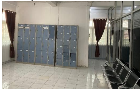
Gambar 7. Loker Perpustakaan UMP

Perpustakaan Universitas Muhammadiyah juga menyediakan fasilitas pendukung berupa loker penitipan tas bagi pemustaka. Fasilitas ini disediakan untuk memberikan kenyamanan dan keamanan, sehingga pengunjung dapat menyimpan barang bawaannya dengan aman sebelum memasuki ruang baca. Dengan adanya loker tersebut, pemustaka dapat lebih leluasa dalam menggunakan koleksi dan layanan perpustakaan tanpa perlu khawatir terhadap barang pribadinya.