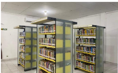
Gambar 2. Koleksi tercetak (koleksi umum) Perpustakaan Universitas Muhammadiyah Palembang

Koleksi buku menjadi salah satu fasilitas utama yang tersedia dalam jumlah besar dengan cakupan beragam disiplin ilmu, mulai dari ilmu sosial, humaniora, sains, hingga keislaman. Selain itu, perpustakaan juga menyediakan koleksi jurnal baik nasional maupun internasional yang memuat hasil-hasil penelitian terbaru. Kehadiran jurnal ini menjadi sumber informasi penting bagi mahasiswa, dosen, dan peneliti dalam mendukung kegiatan akademik dan penelitian.