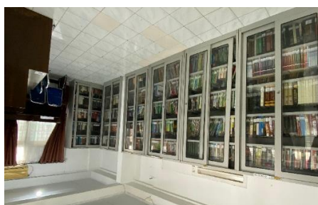
Gambar 3. Koleksi Referensi Perpustakaan Universitas Muhammadiyah Palembang

Sebagai pendukung proses penelitian, Perpustakaan Universitas Muhammadiyah Palembang menyediakan layanan referensi yang dilengkapi dengan berbagai koleksi referensi, seperti ensiklopedia, kamus, direktori, bibliografi, handbook, dan sumber rujukan lainnya. Koleksi ini tidak dapat dipinjam untuk dibawa pulang, melainkan hanya digunakan di tempat, agar tetap tersedia dan dapat dimanfaatkan oleh seluruh pemustaka. Melalui layanan referensi ini, mahasiswa, dosen, dan peneliti dapat memperoleh informasi yang akurat, terpercaya, dan relevan untuk menunjang kebutuhan akademik maupun penelitian.