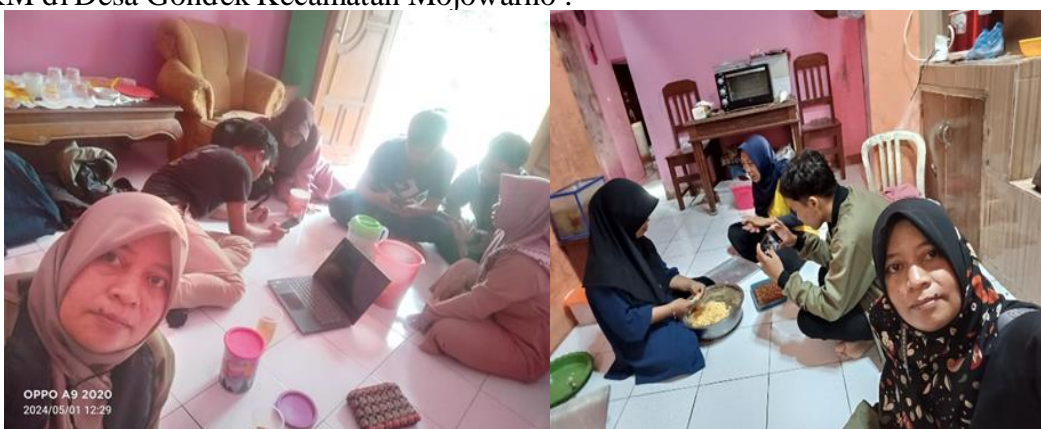
Gambar 1. Dokumentasi Pendampingan Pendaftaran NIB

Berikut ini adalah dokumentasi selama pendampingan pendaftaran NIB bagi pelaku UMKM di Desa Gondok Kecamatan Mojowarno :