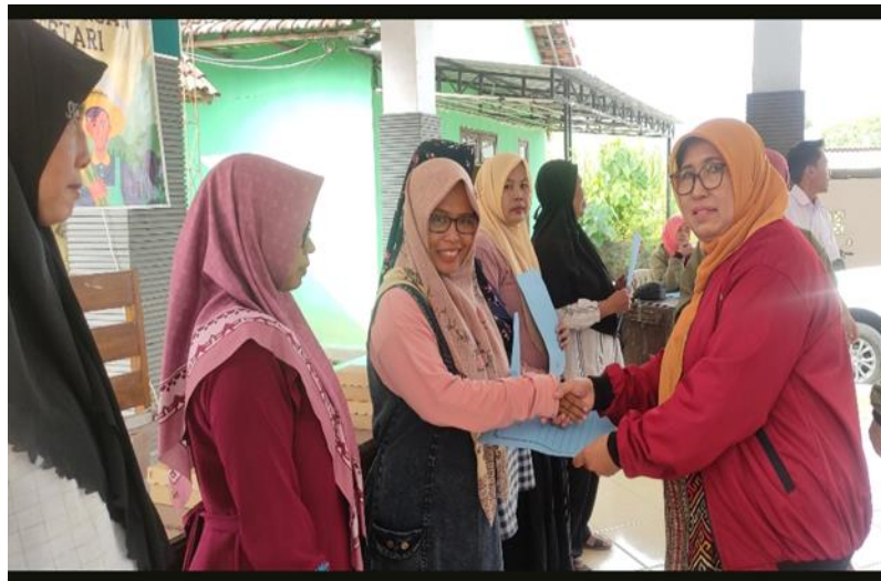
Gambar 2. Penyerahan Dokumen NIB kepada pelaku UMKM