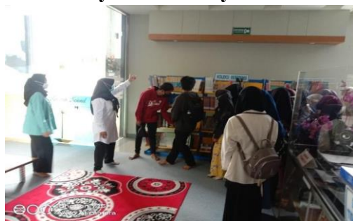
Gambar 5 Library Tour di Layanan Anak

Sumber: Dokumentasi Pribadi, Januari 2022