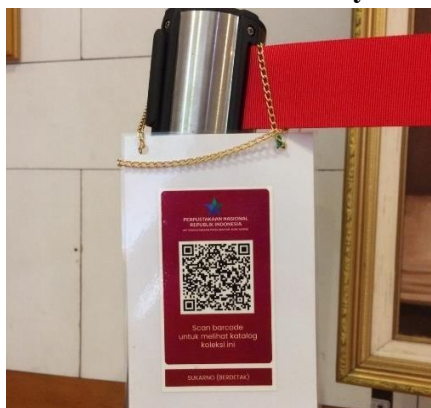
Gambar 1 QR Code pada Salah Satu Koleksi di Layanan Memorabilia

Koleksi memorabilia yang telah memiliki QR Code sebanyak 25 jenis koleksi yang bersifat realia atau 3 dimensi. QR Code tersebut kemudian akan dicetak dalam bentuk sticker kemudian di tempel pada tempat yang telah ditentukan yang pastinya berdekatan dengan koleksi tersebut.