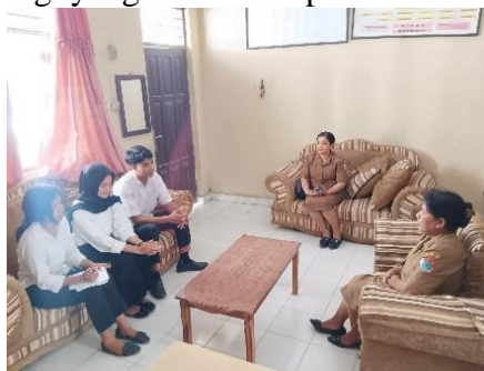
Gambar 1: wawancara bersama kepala sekolah dan guru pamong

Tahap awal diawali dengan identifikasi kebutuhan pembelajaran melalui observasi dan wawancara kepada Kepala sekolah dan Guru pamong untuk memetakan kendala yang dihadapi dalam proses pembelajaran. Hasil identifikasi ini menjadi dasar dalam menentukan bentuk media ajar dan teknologi yang akan diterapkan di SD Inpres Malumbi.