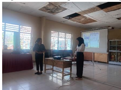
gambar 10. sosialisasi penggunaan Canva

Pelatihan ini mencakup pengenalan fitur-fitur elemen dalam aplikasi dan cara penggunaan aplikasi Canva sebagai upaya dalam meningkatkan keterampilan teknologi bagi guru-guru di SD Inpres Malumbi dalam penyampaian materi ajar, pembuatan RPP, LKPD, Poster, baliho kegiatan dan sebagai bentuk adaptasi teknologi.