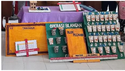
Gambar 4: alat perga literasi dan numerasi