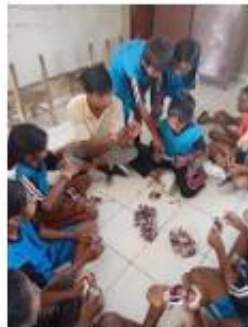
Gambar 14: pembuatan tas dari plastik kopo ABC

Pelaksanaan Proyek Penguatan Profil Pelajar Pancasila (P5) dilaksanakan melalui kegiatan pembelajaran berbasis proyek yang melibatkan partisipasi aktif siswa. Kegiatan P5 dirancang untuk menanamkan nilai-nilai Profil Pelajar Pancasila, khususnya dimensi bernalar kritis, kreatif, gotong royong, dan mandiri. Siswa dilibatkan secara langsung dalam perencanaan, pelaksanaan, hingga penyajian hasil proyek, sehingga pembelajaran menjadi lebih bermakna dan kontekstual. Dalam kegiatan ini siswa diminta untuk memanfaatkan sampah plastik seperti bungkus kopi sachet ABC Plus untuk membuat karya tas sekolah.