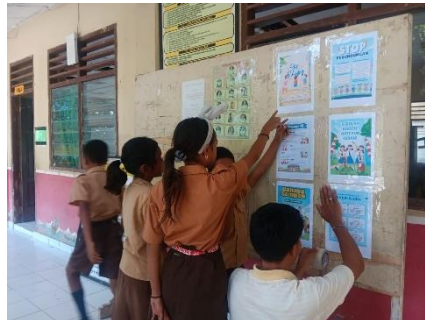
gambar 7; poster edukasi

Poster edukasi digunakan sebagai media visual yang berfungsi untuk memperkuat pemahaman peserta didik terhadap materi pembelajaran serta menanamkan nilai-nilai karakter. Poster yang dibuat memuat berbagai tema, seperti literasi membaca, numerasi, kebersihan lingkungan, etika di sekolah, dan motivasi belajar. Penempatan poster dilakukan secara strategis di ruang kelas, lorong sekolah, dan area perpustakaan agar mudah dilihat dan dibaca oleh peserta didik. Hasil pelaksanaan program menunjukkan bahwa keberadaan poster edukasi mampu menarik perhatian peserta didik dan membantu mereka mengingat pesan-pesan pembelajaran dengan lebih baik. Media visual ini juga memudahkan guru dalam menyampaikan materi secara kontekstual serta menciptakan suasana belajar yang lebih hidup. Selain itu, poster edukasi berperan sebagai pengingat berkelanjutan bagi peserta didik terhadap perilaku positif yang diharapkan di lingkungan sekolah