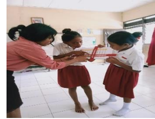
Gambar 6: simulasi penggunaan alat peraga Takapat