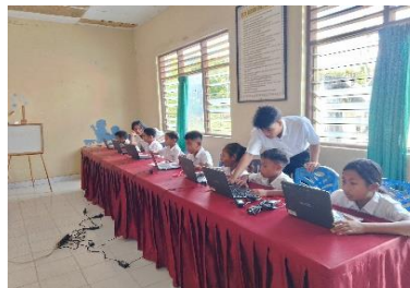
Gambar 9: pelatihan menaunaan Chrome book

Dalam kegiatan ini, mahasiswa memperkenalkan keterampilan dasar penggunaan teknologi seperti laptop/chromebook untuk membantu siswa dalam literasi digital. Melalui kegiatan ini siswa dapat mempelajari dasar-dasar penggunaan alat teknologi terutama bagi siswa kelas V yang dipersiapkan untuk melakukan ANBK.