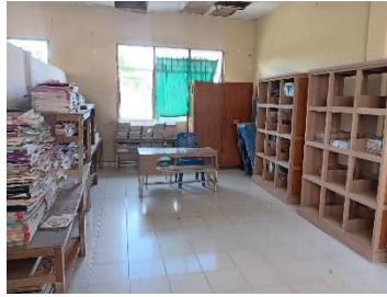
gambar 8; perpustakaan