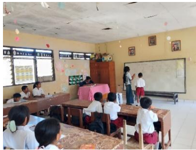
Gambar 2: pembelajaran di kelas VA

Mahasiswa Asistensi Mengajar terlibat langsung dalam kegiatan pembelajaran di dalam kelas IV A, IV B, V A, V B, dan VI. Kegiatan ini dilaksanakan sesuai roster harian di setiap kelas pada mata pelajaran Matematika dan IPA, dalam kegiatan tersebut meliputi penyampaian materi berdasarkan pada Rencana Pelaksanaan Pembelajaran (RPP) atau modul ajar sesuai kurikulum yang berlaku di sekolah dan sesuai kebutuhan siswa.