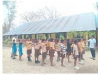
Gambar 12: pelaksanaan kegiatan gerakan Pramuka