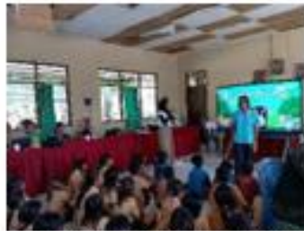
Gambar 13: sosialisasi anti bullying

Dalam kegiatan ini, siswa diperkenalkan mengenai apa itu bullying, bentuk-bentuknya (verbal, fisik, maupun sosial), serta dampak buruk yang ditimbulkan bagi korban maupun lingkungan sekolah. Sosialisasi dilaksanakan melalui metode interaktif seperti cerita bergambar, pemutaran video pendek, permainan peran (role play), dan diskusi kelompok kecil yang disesuaikan dengan usia anak SD agar mudah dipahami.