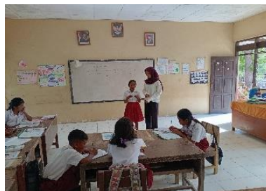
Gambar 3 : pendampingan kegiatan literasi

Kegiatan ini diadakan dengan harapan dapat menumbuhkan minat baca, tulis dan rasa ingin tau siswa melalui media visual seperti poster bergambar, buku- buku fiksi yang tersedia di perpustakaan atau pojok baca di ruang kelas. Kami pun berupaya untuk memanfaatkan lebih baik terhadap fasilitas pojok baca yang tersedia, sehingga siswa memiliki ketertarikan untuk membaca dan menemukan informasi baru sebelum melalui pembelajaran di pagi hari, siswa diberikan kesempatan selama 15-30 menit untuk berkeliling dan membaca poster atau buku-buku yang tersedia di pojok baca.