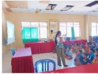
Gambar 11: sosialisasi gerakan Pramuka