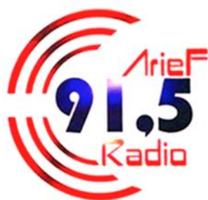
Gambar 1. Logo PT. Radio Arief Elkobana

Filosofis logo di atas, elemen gelombang yang terletak pada logo sekarang yaitu gelombang yang memancarkan saluran frekuensi radio dengan segment anak muda agar lebih dekat dengan pendengar terutama anak muda dan menjadikan radio favorite di kalangan anak muda. Berdasarkan analisis penulis desain logo PT Radio Arief Elkobana memiliki kekurangan dalam segi prinsip seni dan unsur seni dan konseptual dari filosofis di atas.