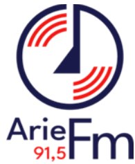
Gambar 2. Hasil Redesain Logo

Kata klasik yang memiliki arti masa lampau tetapi memiliki nilai yang tinggi. Hal ini menggambarkan radio yang merupakan radio pertama di kota Payakumbuh, tetapi masih melakukan upgrade pada jangkauan pendengar, berita terkini, lagu-lagu terbaru, dan sudah melakukan streaming online yang bisa didengar satu Indonesia.