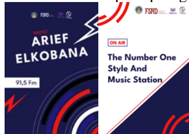
Gambar 4. Gambar (A) Hasil Poster dan gambar (B) poster tagline

Poster ini di desain menggunakan warna biru, merah dan putih, elemen garis pada poster menandakan sebuah alat memutar music pada piringan hitam.