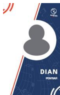
Gambar 6. Hasil Karya ID Card