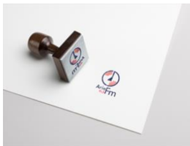
Gambar 8. Stempel

Stempel ini menggunakan tinta sesuai dengan warna logo yaitu biru dan merah. Stempel termasuk kedalam bauran media radio karena surat-surat penting untuk meminta persetujuan pihak radio memerlukan stempel. Agar memastikan dokumen asli atau tidak dapat dipalsukan. Selain itu menjadi media dalam memperkenalkan identitas visual kepada konsumen.