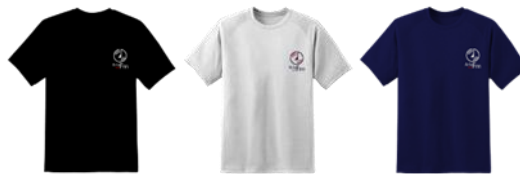
Gambar 10. T-shirt

Baju yang dipakai seragam untuk kerja memberikan kesan konsisten dan profesional kepada audiens. Karyawan yang memakai seragam kerja meningkatkan identitas brand dengan ciri khas tersendiri. Seragam bisa menjadi alat pembeda dari para pesaing. Jika dipakai pada sebuah acara akan menjadi iklan berjalan karena orang di sekitar akan mudah mengenali perusahaan tersebut.