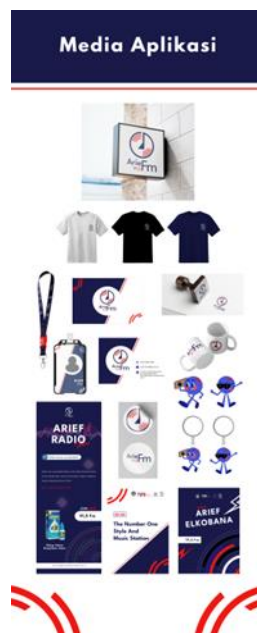
Gambar 5. Hasil Karya Media Aplikasi

Media aplikasi merupakan kumpulan bauran media atau media cetak yang dijadikan satu untuk media pajang agar informasi tersampaikan dengan jelas, singkat kepada audiens.