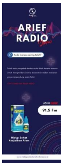
Gambar 7. Hasil Karya X-Banner

Tujuan X-Banner ini dibuat untuk mempromosikan program talkshow mengenai kesehatan obat herbal jamu Mansapro. Yang akan dilakukan secara on air, Pada media x-banner menggunakan body text yang merupakan bagian dari teks yang membentuk kata-kata dan kalimat dalam suatu teks untuk menyampaikan pesan-pesan kepada target audiens. X-banner berukuran 60cm x 160cm dengan jenis bahan albatross.