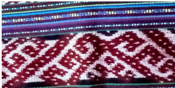
Gambar 3 Motif Kai Ne’e

Motif berikut dalam masyarakat disebut motif Kai, Ne’e motif ini dapat dilihat pada gambar dbawah