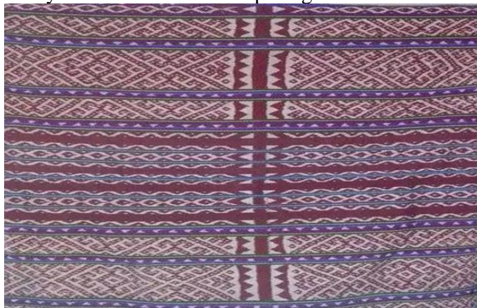
Gambar 4 Motif Pan Buay Ana

Motif keempat yang ada dalam tenun ikat (futus) pada masyarakat di Desa Tunbaun adalah Motif Pan Buay Ana motif ini di lihat pada gambar dibawah