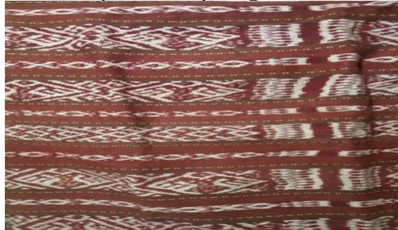
. Gambar 2 Motif korkase

Motif kedua yang ada dalam tenun ikat (futus) pada tenunan amarasi di Desa Tunbaun adalah: motif korkase motif ini dapat di lihat pada gambar di bawah.