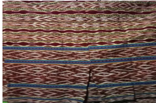
Gambar 1 Motif Kaimanfafa

Motif pertama yang ada dalam tenunan ikat (futus) masyarakat Desa Tunbaun adalah motif kaimanfafa. Motif kaimanfafa terlihat pada gambar di bawah ini.