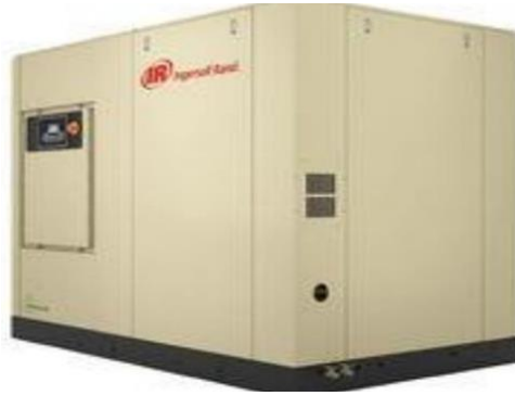
Gambar 1 Screw Compressor SH250